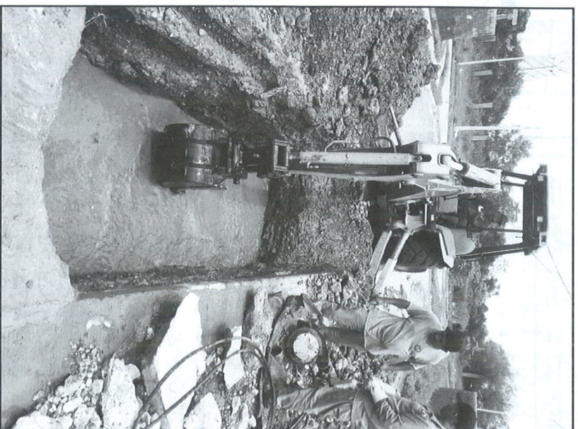
Trabajadores del municipio laboraron en diversas frentes.

En esta ocasión se habilitaron cinco alberques y participaron más de 200 elementos entre policías, tránsito, elementos de bomberos y protección civil. Se acordaron zonas de inundación,